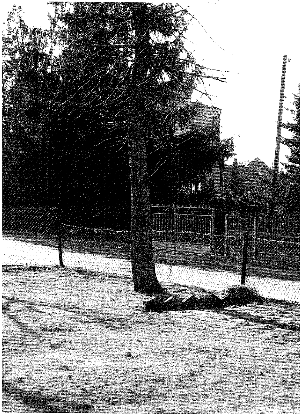
ПРЕСТАВН ГРОХОДРДЕУ (АКАЦА)