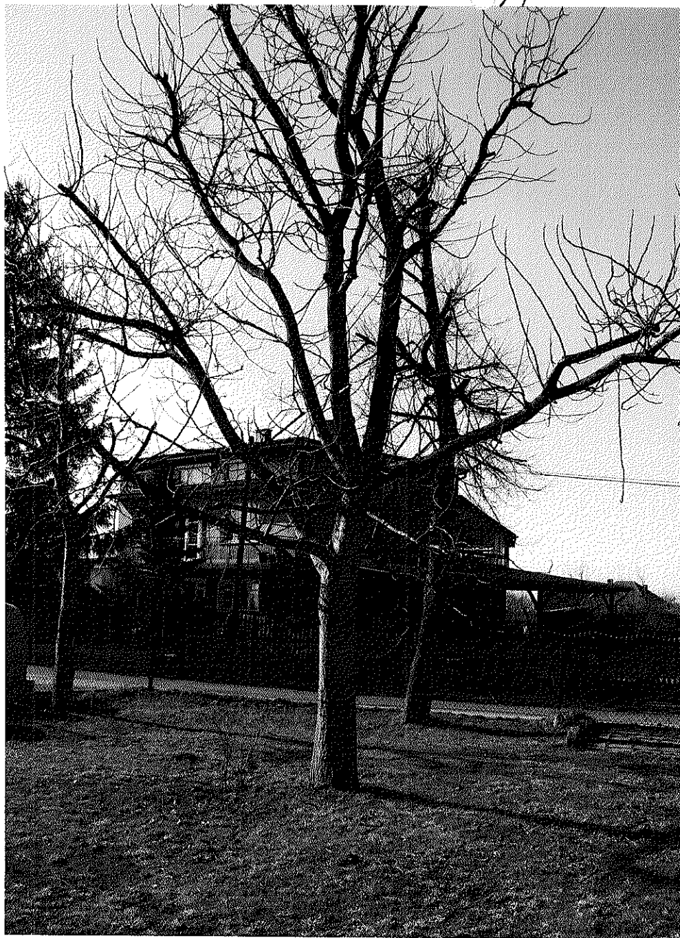
PRZYSTAJN ORZECH WŁOSKI